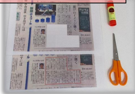
新聞記事の切り抜き